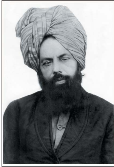
سيدنا مرزا غلام أحمد القادياني عليه السلام