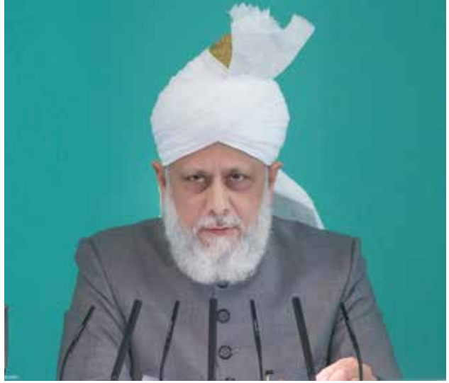
حضرة مرزا مسرور أحمد أيده الله بنصره العزيز

المراد من التقوى هو أن يكون كل عمل من أعمالكم لنيل رضا الله تعالى، ففي هذه الحالة فقط تستطيعون أن تستفيدوا من الصيام وتجنبوا هجمات الشيطان. فإذا صتمتم لوجه الله خالصة متمسكين بأهداب التقوى ستحظون بحماية الله تعالى.